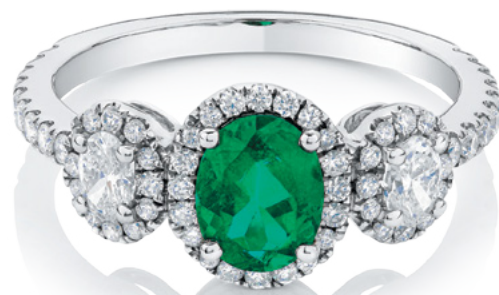
51966R Anillo de oro blanco, diamantes y esmeraldas

Las esmeraldas atraen la energía positiva. Es la piedra del amor sincero, la felicidad y la fuerza interior. Y hay quienes le atribuyen el poder de la esperanza o la fertilidad. Combinadas con diamantes, son un tesoro único para quienes sienten las joyas como un amuleto de vida.