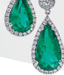
51931N Collar de oro blanco, diamantes y esmeraldas