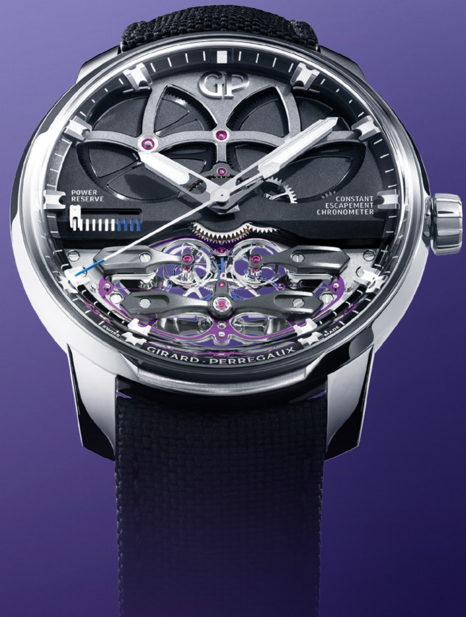
Neo Constant Escapement Independent Haute Horlogerie Since 1791