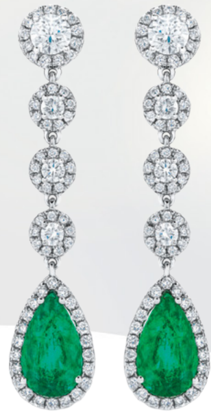
51928E Aretes de oro blanco, diamantes y esmeraldas

ESTILO ETERNO La magia de las piedras preciosas cobra vida con estos diseños atemporales y modernos de Berger.